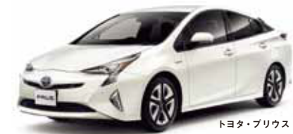
トヨタ・プリウス